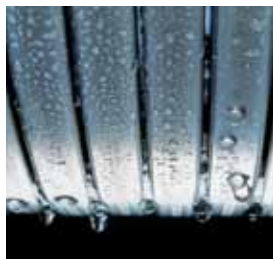
Echangeur de chaleur Inox-radial – durable et efficace