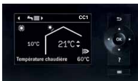
Ecran de la régulation Vitotronic 200