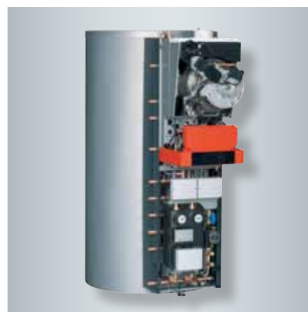
Vitosolar 300-F avec chaudière fioul murale à condensation Vitoladens 300-W

La Vitosolar 300-F fonctionne en combinaison avec une chaudière fioul ou gaz murale à condensation. Grâce au raccordement d'une chaudière pour le bois ou les granulés de bois, le fonctionnement neutre en CO 2 contribue à la protection durable du climat.